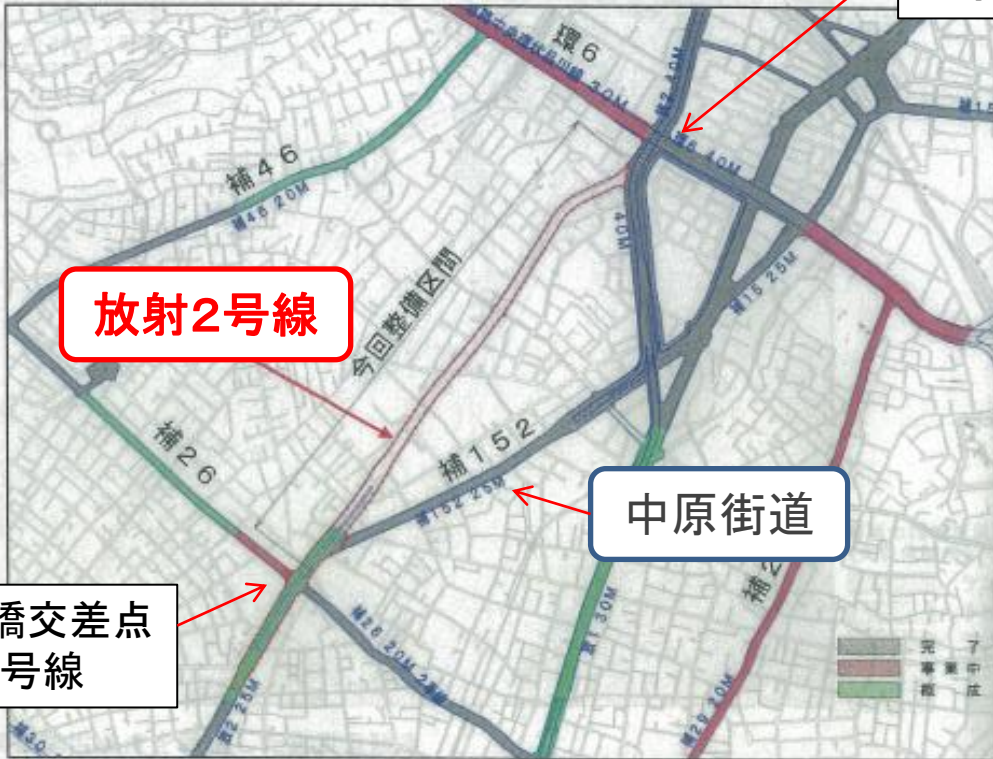
図 放射第2号線周辺の道路ネットワーク